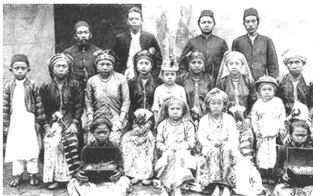
Masyarakat Bawean Singapura, 1910.

Adaptasi diartikan sebagai kemampuan suatu sistem untuk menyesuaikan dengan perubahan. Untuk menjelaskan bagaimana budaya merantau suku boyan dapat digambarkan melalui sejarah berkembangnya. Perantau boyan sudah mulai merantau semenjak tahun 1900 an (Kartono, 2004). Hal ini dapat dilihat dari gambar di bawah ini: