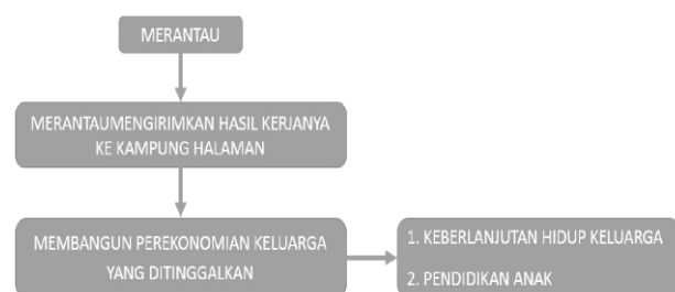
Gambar 3. Skema Tujuan Merantau Masyarakat Bawean