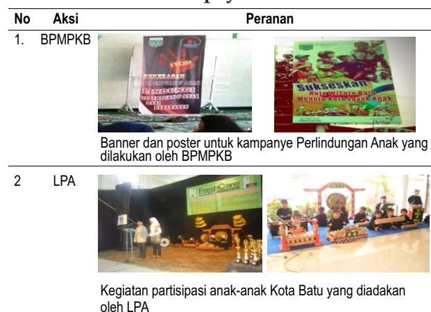
Tabel 3. Upaya Preventif

BPMPKB bersama dengan Lembaga Perlindungan Anak (LPA) Kota Batu melakukan kampanye secara massive kepada masyarakat Kota Batu khususnya anak-anak. Kampanye yang dilakukan tidak hanya melalui desain komunikasi visual seperti banner , poster dan sebagainya. Selain desain visual, kampanye juga dilakukan melalui kegiatan anak-anak seperti lomba mewarnai anak, kegiatan apresiasi seni anak dan sebagainya. Tujuan kampanye ini adalah sebagai penyadaran bagi semua pihak khususnya pada tingkatan keluarga mengenai pentingnya hak anak dan perlindungan anak.