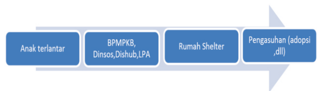
Gambar 2. Upaya Rehabilitasi Anak Terlantar