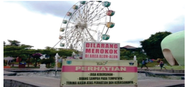
Gambar 4. Penyediaan Fasilitas untuk Keselamatan Anak Kota Batu

digunakan anak untuk mengisi waktu luangnya seperti pembuatan 1 lokasi hutan kota di Kelurahan Sisir, 1 lokasi ruang terbuka bermain di Alun-alun, 3 lokasi ruang terbuka Taman bermain di Kelurahan Sisir dan Desa Bulukerto.