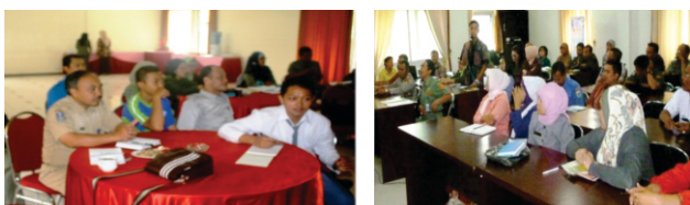
Gambar 3. Partisipasi Anak pada Perumusan KLA di Kota Batu

Wujud penghargaan yang diberikan oleh Pemerintah Kota Batu adalah pengadaan ruang-ruang publik bagi anak untuk berpartisipasi dalam pembangunan, misalnya dalam Musyawarah Perencanaan Pembangunan baik tingkat desa maupun kota. Anak Kota Batu tergabung dalam wadah Forum Anak (FA) mulai dari tingkat desa sampai kota.