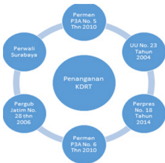
Gambar 2 Kolaborasi Peraturan dalam Penanganan KDRT di Surabaya

Dasar hukum dari collaborative governance TP2TP2A Kota Surabaya terkait dengan upaya mengatasi tindak kekerasan terhadap perempuan dan anak di daerah Surabaya, didasarkan pada peraturan sebagai berikut: